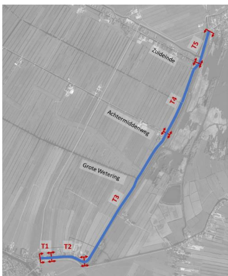
Figuur 3: Variant West

Alternatief Oost ten zuiden van de kruising met de Zierendevaart en het Combinatie-Alternatief vervallen. Het kruisen van de Zierendevaart middels een beweegbare of hoge brug wordt niet realistisch geacht. Het noordelijke deel is meegenomen als onderdeel van West Variant Plus, Optie 1.