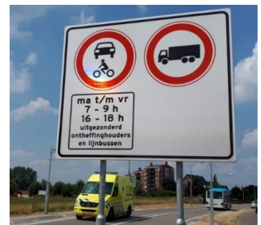
Figuur 8: Voorbeeld: Afgesloten tijdens spits d.m.v. bebording.

Onder optie 1 zijn rode fietssuggestiestroken of een fietsstraat niet inpasbaar gezien de breedte van de weg, verhouding fietsers / motorvoertuigen en status van de fietsroute. Extra drempels leveren hinder op voor landbouwverkeer. Deze variant valt af. Optie 3 is mogelijk middels bebording, fysieke afsluiting of een verkeerslicht. De Zierendeweg is dan tijdens de spits alleen te berijden voor bestemmingsverkeer. Of verkeer wordt dusdanig vertraagd dat men eerder kiest voor de route via de N231 en N207. Hoewel dit een verlichting geeft tijdens de spits is dit geen oplossing voor de rest van de dag en in het weekend. Ook deze variant valt af.