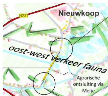
Figuur 7: Voorbeeldverbod afsluiten voor doorgaand verkeer.