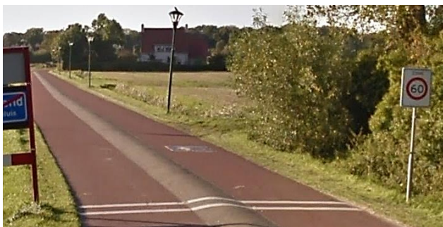
Figuur 6: Voorbeeld 'Fietsstraat' buitengebied.