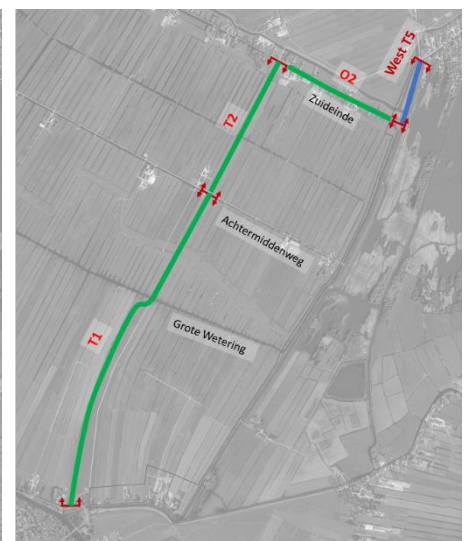
Figuur 5: Variant West Plus 2

De varianten zijn vergeleken op basis van kosten, draagvlak en hun invloed op de archeologische en cultuurhistorische waarden, water- en bodemsituatie, natuurwaarden, verkeerssituatie en recreatie en toerisme. Op basis van deze gebiedsbrede beschouwing scoort Variant West op nagenoeg alle thema's beter dan Variant West Plus. De geraamde kosten van Variant West Plus vallen hoger uit. Door de ligging van Variant West langs de Zierendeweg is de impact op cultuurhistorische (landschappelijke) en ecologische waarden minder dan de Variant West Plus opties, welke de open polders gedeeltelijk doorkruisen. Variant West Plus kan ook op minder draagvlak rekenen, met daarmee een hogere risico op moeizame planologische procedures.