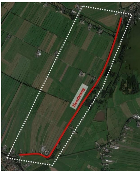
Figuur 1: Zierendeweg en projectscope verkenning

Van: E.G. Wienk Datum: 21 december 2020 Referentie: Verkenningstudie Zierendeweg Onderwerp: Oplegnotitie