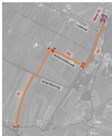
Figuur 4: Variant West Plus 1