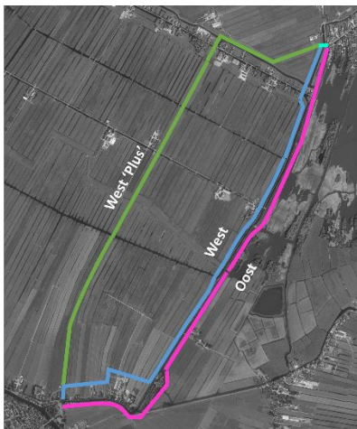
Figuur 2: Oplossingsrichtingen vrijliggend fietspad

Bij de start van het onderzoek heeft een ontwerpessie plaatsgevonden met de gemeente Nieuwkoop, de gemeente Bodegraven Reeuwijk, het Hoogheemraadschap van Rijnland en de Stichting Landschapsfonds. Tijdens deze ontwerpessie zijn een aantal oplossingsrichtingen op hoofdlijnen opgesteld;